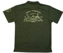
すそのんポロシャツ グリーンカフェ花麒麟 サワキウスポーツ