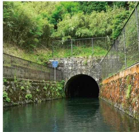
深良用水特別展示 裾野市石脇586 裾野市民文化センター内 TEL/055-993-9300 営業時間/8:30~21:30 定休日/第1・3・5月、年末年始