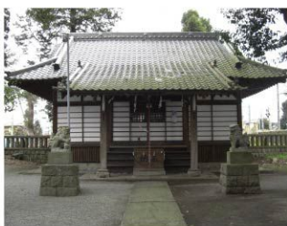
裾野市平松350 ※社務所の対応時間は要確認

南北朝時代、箱根竹之下の戦いで敗れ討死した二条為冬(冬)の霊を祀った神社、1876年に創建。御祭神「二条為冬(冬)」は字問と文芸の神様で、境内には歌人柳原白蓮が寄進した鈴も残されています。季節の御朱印も人気。