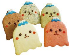
すそのんクッキー ビューティーチェリーカフェ