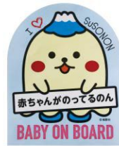
すそのんステッカー やさい食堂 楽風