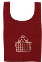
すそのんマルシェバッグ グリーンカフェ花麒麟