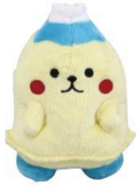
すそのんぬいぐるみ(小・大) Studio O&K裾野店