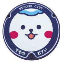
すそのんマンホール 裾野市役所