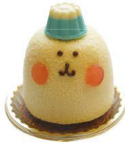
Mt.すそのん 富士の里洋菓子店