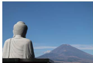
裾野市深良1939西安寺 TEL/090-5037-3260 営業時間/11:00~日暮れまで(平日) ※土日は10:00~ 定休日/火・水

西安寺の大仏の隣にある小さな茶屋からは、お汁粉をいただきながら富士山の優美な稜線をながめることができます。ほっと一息、ゆったり富士山と語り合う時間は贅沢です。