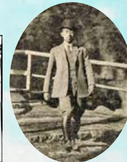
昭和天皇(皇太子時代)行啓