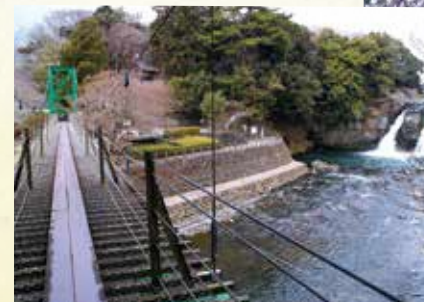
吊橋「五竜のかけはし」

五龍館佐野ホテルの前の橋は太鼓橋から吊橋へと何度か架け替えられており、当時をイメージして昭和53年に長さ34mの太鼓橋「夢の橋」や長さ63mの吊橋「五竜のかけはし」が整備されました。吊橋からは、五竜の滝を正面から見ることができます。※吊橋は定員5名です。