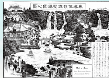
東海の偉観といわれた佐野瀑園

昭和9年(1934年)、丹那トンネル開通により東海道線が熱海ルートに変更され旧ルートが御殿場線になったことにより五龍館ホテルは衰退していきました。